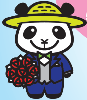
JAバンクえひめキャラクター ばんじゃくん