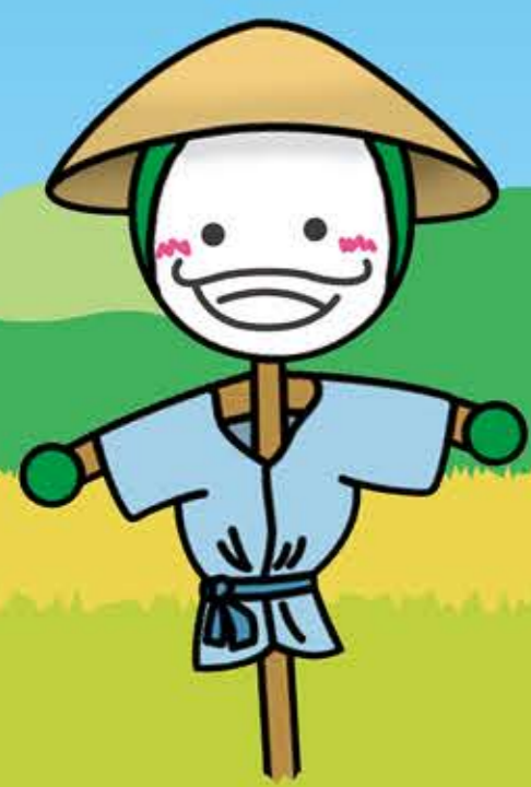
JA松山市イメージキャラクター 青空土男