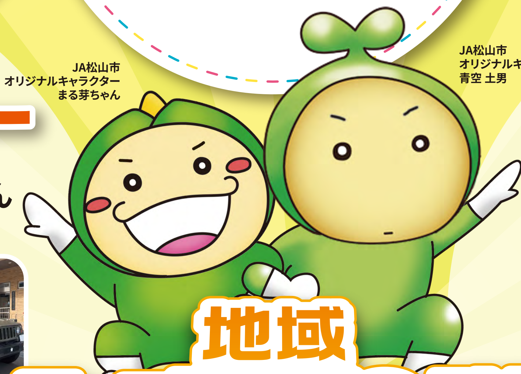
JA松山市 オリジナルキャラクター まる芽ちゃん